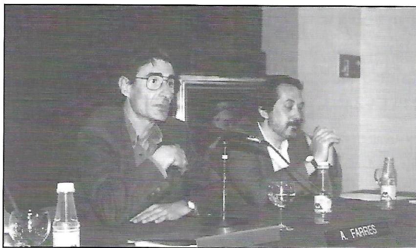
L'Alcalde de Sabadell, Antoni Farrés, va presidir l'acte de lliurament de premis de la primera edició del Concurs de Redacció sobre la solidaritat.

La inscripció es oberta fins el 4 de març al Casal d'Europa i a la Lliga.